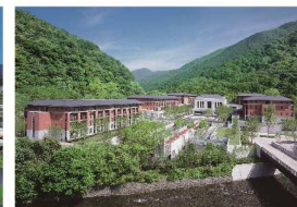
エクシブ京都 八瀬離宮