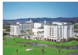
グランドエクシブ浜名湖