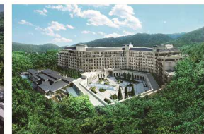
エクシブ有馬離宮